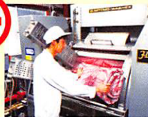
おふとんの丸洗い作業