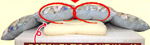
この部分に足し羽毛で、えり元がふっくら えり元に40グラムを足し羽毛後