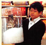
40グラムの足し羽毛です